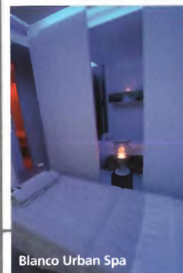
Blanco Urban Spa