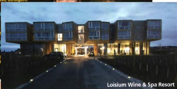
Loisium Wine & Spa Resort

Golf, i green dove stringere le amicizie che investire, guidare e non rischiare Case, le strade più care del nord Passioni in cucina, genio & sex ip Speciale nautica: eco-lusso tra la Per azie Holding, reg Cosa fare più