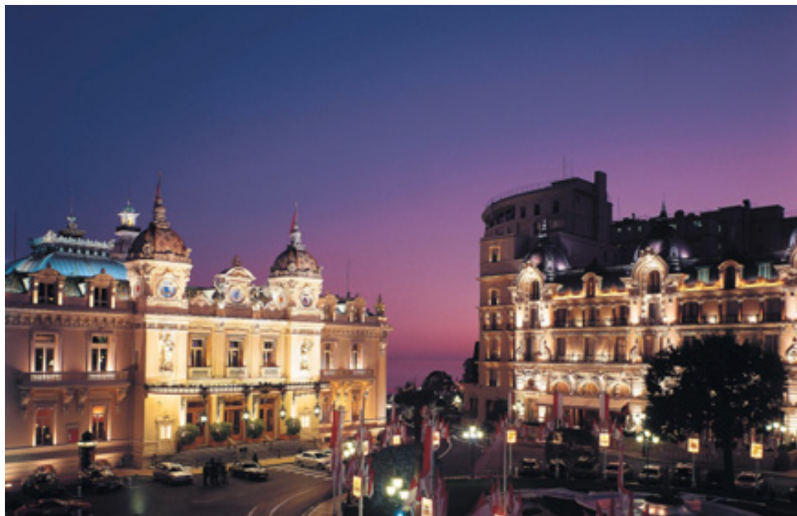
NOTTURNO La suggestiva piazza del Casinò con l'Hotel de Paris

In Valle Isarco, nel comune di Bressanone, con spettacolare vista sulle cime delle Dolomiti, The Vista Hotel è la meta ideale per un weekend romantico da trascorrere tra la neve del comprensorio della Plose e la magnifica spa di 650 metri quadrati con vista panoramica sulle cime dolomitiche, attrezzata con piscina, idromassaggio, diverse tipologie di saune, fontana con acqua di sorgente e sala fitness. Lo speciale pacchetto S. Valentino include: 3 giorni con mezza pensione, drink di benvenuto, un bagno rilassante a scelta, un massaggio corpo, a partire da 331 euro. Informazioni: www.thevistahotel.com , tel. 0472521307